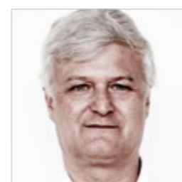
Jesús Henández ESTUDIO LAMELA www.estudiolamela.com