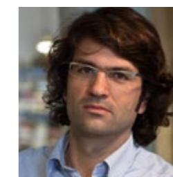
Juan Pedro Donaire DONAIRE ARQUITECTOS www.donairearquitectos.com