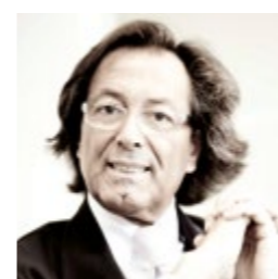
Julio Touza TOUZA ARQUITECTOS www.touza.com