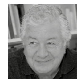
Gerardo Ayala AYALA ARQUITECTOS www.arquitectosayala.com