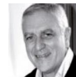
Ángel Asenjo A. ASENJO ASOCIADOS www.asenjo.net